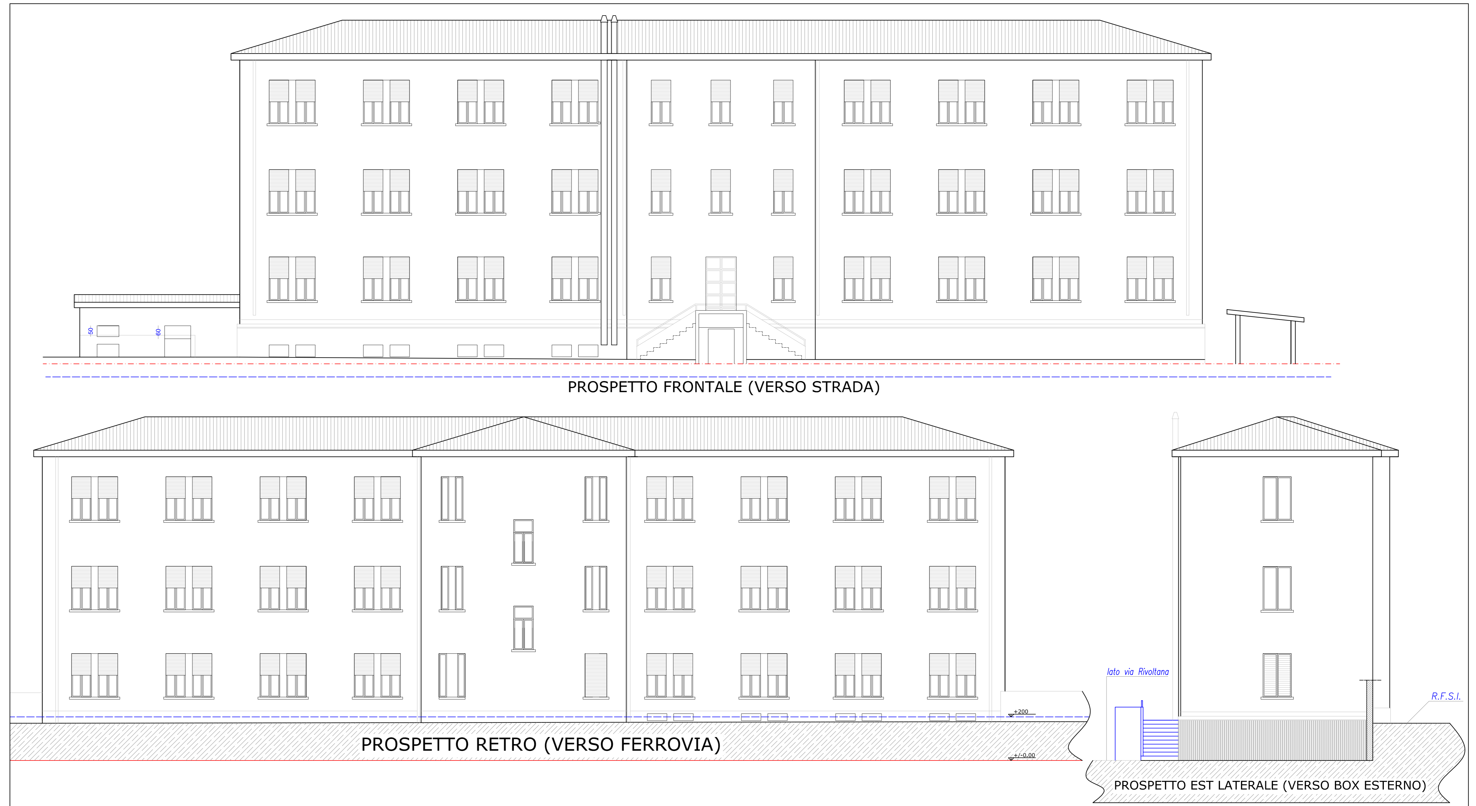
PROSPETTO FRONTALE (VERSO STRADA)